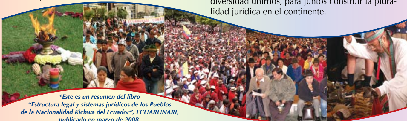
*Este es un resumen del libro "Estructura legal y sistemas jurídicos de los Pueblos de la Nacionalidad Kichwa del Ecuador", ECUARUNARI, publicado en marzo de 2008.

Por todo lo anteriormente anotado es necesario y urgente reconocernos como diversos y en esa diversidad unirnos, para juntos construir la pluralidad jurídica en el continente.